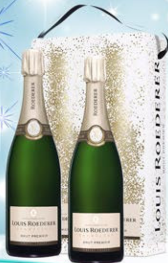
6701078 - C 113,00 * LOUIS ROEDERER BRUT PREMIER CL.75 CONF. X 2