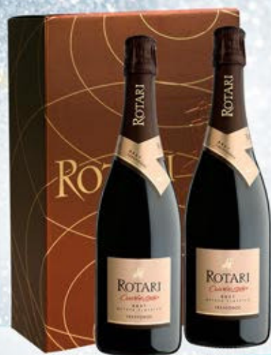
6601319 - C 34,50 * TRENTO DOC CUVÉE 28 "ROTARI" CL.75 CONF. X 2