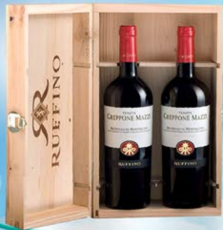
2083035 - C 82,50 INVITO * CASSETTA LEGNO X 2 * 2 BRUNELLO DI MONTALCINO DOCG GREPPONE MAZZI "RUFFINO" CL.75