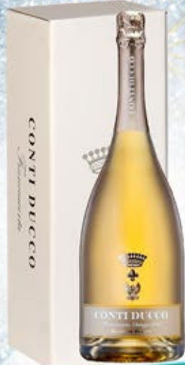
6601334 - C 49,50 * FRANCIA CORTA MILLESIMATO "CONTI DUCCO" CL.150 CONF. X 1