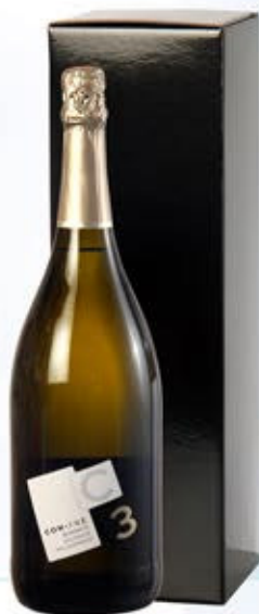
6601458 - C 9,90 * SPUMANTE MILLESIMATO EXTRA DRY CON-TRE "CONTARINI" CL.150 CONF. X 1