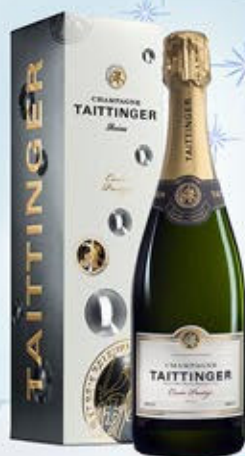
6701027 - C 48,90 * TAITTINGER CUVÉE PRESTIGE CL.75 CONF. X 1