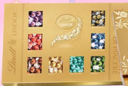
1402311 - C 59,00 * LINDOR ASSORTITA "LINDT" SCATOLA GR.1250