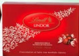
1402309 - C 13,80 LINDOR LATTE * CIOCCOLATINI LINDOR LATTE "LINDT" GR.250