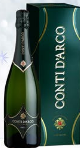
6601191 - C 16,90 * TRENTO DOC CL.75 "CONTI D'ARCO" CL.75 CONF. X 1