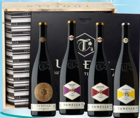
2083099 - C 95,00 TUNELLA X 4 * CASSETTA LEGNO X 4 * RIBOLLA GIALLA "TUNELLA" CL.75 * REFOSCO DAL PEDUNCOLO ROSSO "TUNELLA" CL.75 * CABERNET FRANC "TUNELLA" CL.75 * PIGNOLO "TUNELLA" CL.75