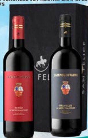
2083096 - C 65,90 SAN FELICE X 2 * CASSETTA LEGNO X 2 * BRUNELLO DI MONTALCINO DOCG "CAMPOGIOVANNI" CL.75 * ROSSO DI MONTALCINO DOC "CAMPOGIOVANNI" CL.75