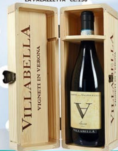
2105044 - C 69,90 AMARONE MAGNUM * CASSETTA LEGNO X MAGNUM * AMARONE DELLA VALPOLICELLA DOC "VILLABELLA" CL.150