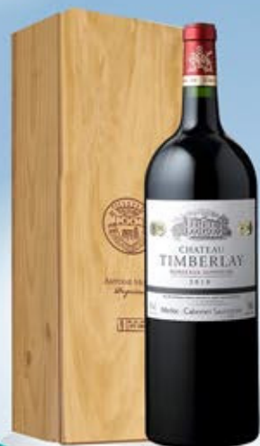
2055297 - C 28,00 BORDEAUX SUPERIEUR MAGNUM * CASSETTA LEGNO X MAGNUM * BORDEAUX SUPERIEUR CHATEAU TIMBERLAY CL.150