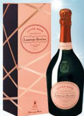
6701026 - C 73,90 * LAURENT PERRIER CUVÉE ROSÉ CL.75 CONF. X 1