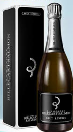
6701083 - C 107,00 * BILLECART-SALMON BRUT RESERVE CL.150 CONF. X 1