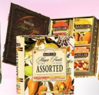
0701007 - C 16,70 LIBRO TE "BASILUR" * LATTA CON 32 BUSTINE DI TÈ NERO E VERDE ALLA FRUTTA