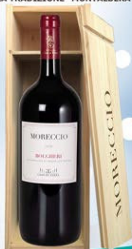
2054038 - C 51,50 BOLGHERI MAGNUM * CASSETTA LEGNO X MAGNUM * BOLGHERI ROSSO DOC "MORECCIO" CL.150