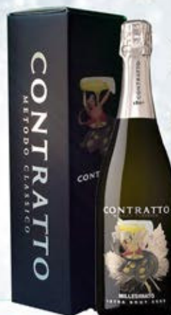
6601055 - C 19,90 *METODO CLASSICO MILLESIMATO PAS DOSÉ "CONTRATTO" CL.75 CONF. X 1