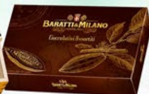
1402026 - C 8,90 SCATOLA ELEGANT "BARATTI & MILANO" * CIOCCOLATINI ASSORTITI "BARATTI & MILANO" GR.250