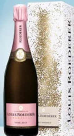
6701003 - C 94,50 * LOUIS ROEDERER ROSÉ VINTAGE CL.75 CONF. X 1