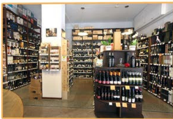
Nel cuore di Genova: Via Malta, 19r 16121 Genova - Tel. 010-565229