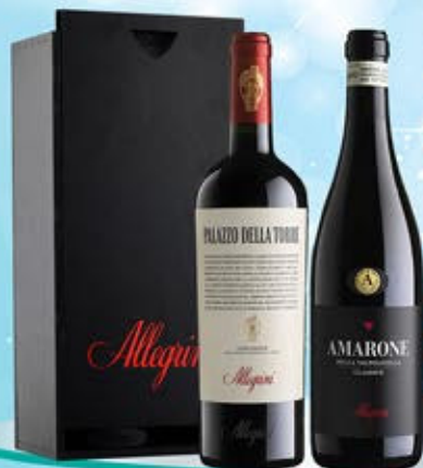
2083100 - C 115,90 ALLEGRI X 2 * CASSETTA LEGNO X 2 * AMARONE DELLA VALPOLICELLA CLASSICO DOCG "ALLEGRI" CL.75 * VERONESE IGT PALAZZO DELLA TORRE "ALLEGRI" CL.75