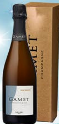
6701229 - C 35,90 * CHAMPAGNE BRUT RIVE DROITE "GAMET" CL.75 CONF. X 1