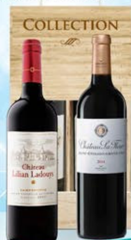
2083098 - C 79,00 CRU X 2 * CHATEAU LA FLEUR SAINT-EMILION GRAND CRU CL.75 * CHATEAU LILIAN LADOUS SAINT-ESTEPHE CRU BOURGEOIS CL.75