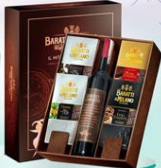
1402031 - C 35,00 IL MITO & IL VIAGGIO "BARATTI & MILANO" * BAROLO CHINATO CL.50 * 4 TAVOLETTE FONDENTI ASSORTITE GR.75