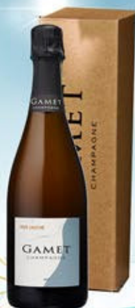
6701228 - C 38,50 * CHAMPAGNE BRUT RIVE GAUCHE "GAMET" CL.75 CONF. X 1