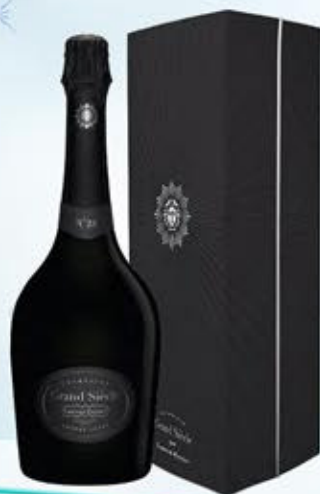
6701120 - C 144,90 * LAURENT PERRIER GRAND SIÈCLE CL.75 CONF. X 1