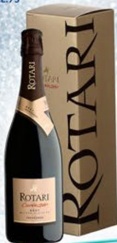
6601318 - C 16,50 * TRENTO DOC CUVÉE 28 "ROTARI" CL.75 CONF. X 1