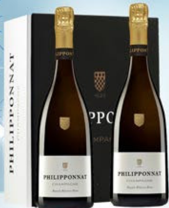
6701048 - C 96,30 * PHILIPPONNAT ROYALE RESERVE BRUT CL.75 CONF. X 2