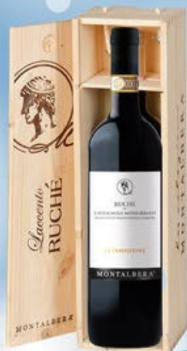
2101039 - C 36,10 RUCHE' MAGNUM * CASSETTA LEGNO X MAGNUM * RUCHE' DI CASTAGNOLE MONFERRATO DOC LA TRADIZIONE "MONTALBERA" CL.150