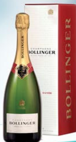
6701106 - C 59,90 * BOLLINGER SPECIAL CUVÉE CL.75 CONF. X 1