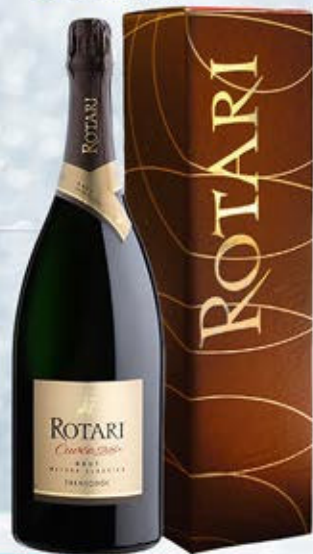
6601354 - C 31,50 * TRENTO DOC CUVÉE 28 "ROTARI" CL.150 CONF. X 1