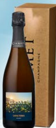
6701230 - C 53,90 * CHAMPAGNE EXTRA BRUT CARACTERE "GAMET" CL.75 CONF. X 1