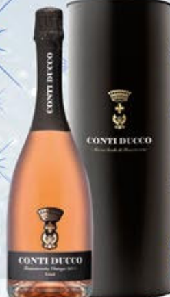
6601286 - C 23,90 * FRANCIA CORTA MILLESIMATO ROSÉ "CONTI DUCCO" CL.75 CONF. X 1