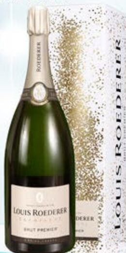
6701079 - C 124,60 * LOUIS ROEDERER BRUT PREMIER CL.150 CONF. X 1