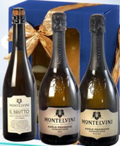
5081002 - C 31,50 ASOLO X 3 * CASSETTA STESA X 3 * PROSECCO SUPERIORE BRUT DOCG ASOLO "MONTELVINI" CL.75 * PROSECCO SUPERIORE EXTRA DRY DOCG ASOLO "MONTELVINI" CL.75 * PROSECCO DOCG ASOLO COLFONDO "IL BRUTTO MONTELVINI" CL.75