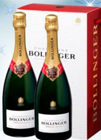
6701176 - C 135,90 * BOLLINGER SPECIAL CUVÉE CL.75 CONF. X 2