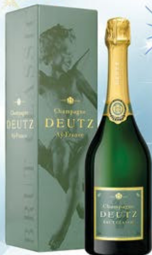
6701218 - C 108,00 * DEUTZ BRUT CLASSIC CL.150 CONF. X 1