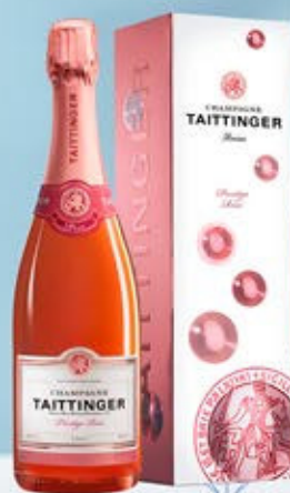
6701040 - C 75,90 * TAITTINGER PRESTIGE ROSÉ CL.75 CONF. X 1