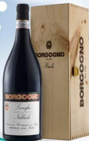
2101182 - C 59,90 NEBBIOLO MAGNUM * CASSETTA LEGNO X MAGNUM * LANGHE DOC NEBBIOLO "BORGOGNO" CL.150