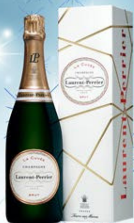
6701090 - C 39,90 * LAURENT PERRIER BRUT CL.75 CONF. X 1