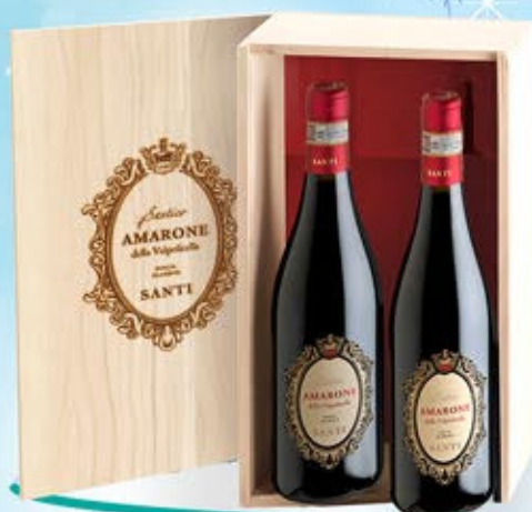
2083089 - C 56,90 SANTICO X 2 * CASSETTA NATURALE LEGNO SQUILLARI X 2 * 2 AMARONE DELLA VALPOLICELLA CLASSICO DOCG SANTICO "SANTI" CL.75