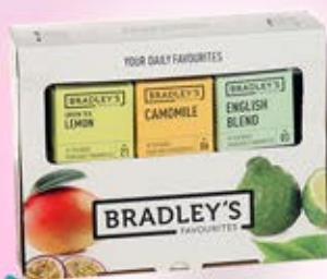
0701030 - C 24,70 * TE BRADLEY'S 12 CONF. X 10 BUSTINE DI TÈ ASSORTITO "BRADLEY'S" ORIGINARIO DELLO SRI LANKA