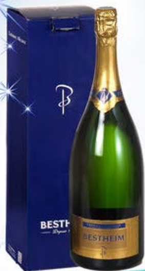
6601287 - C 24,90 * CRÉMANT D'ALSACE BRUT "BESTHEIM" CL.150 CONF. X 1