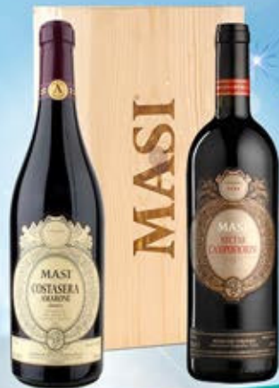
2083081 - C 64,50 MASI X 2 * CASSETTA LEGNO X 2 * AMARONE DELLA VALPOLICELLA DOC COSTASERA "MASI" CL.75 * ROSSO DEL VERONESE IGT NECTAR CAMPOFIORIN "MASI" CL.75