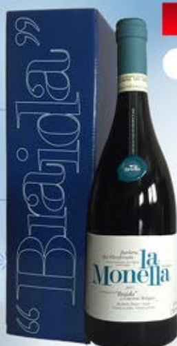
2101110 - C 29,90 MONELLA MAGNUM * CONFEZIONE X MAGNUM * BARBERA DEL MONFERRATO DOC LA MONELLA "BRAIDA" CL.150