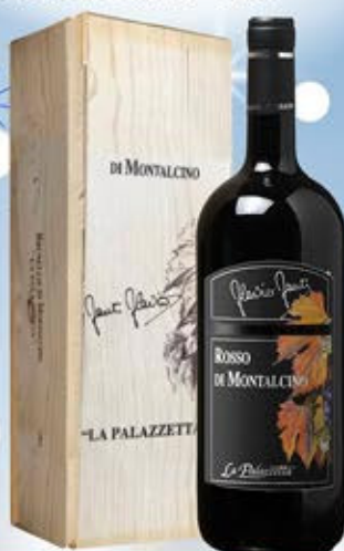
2109113 - C 46,90 ROSSO DI MONTALCINO MAGNUM * CASSETTA LEGNO X MAGNUM * ROSSO DI MONTALCINO DOC "LA PALAZZETTA" CL.150