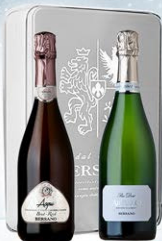
6601128 - C 49,90 LATTA BERSANO X 2 * METODO CLASSICO BRUT PAS DOSÉ "ARTURO BERSANO" CL.75 * ACQUI DOCG BRUT ROSÉ "BERSANO" CL.75