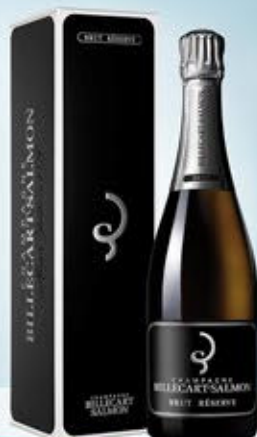
6701116 - C 45,00 * BILLECART-SALMON BRUT RESERVE CL.75 CONF. X 1