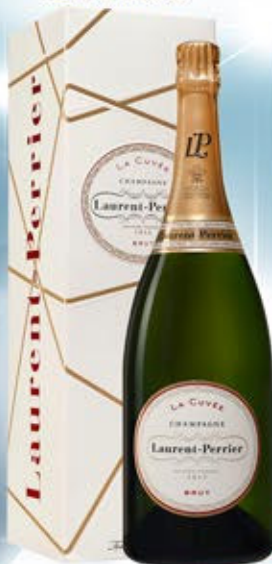
6701019 - C 96,90 * LAURENT PERRIER BRUT MAGNUM CL.150 CONF. X 1