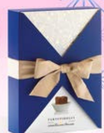
1402553 - C 24,50 * DOLCEZZE IN BLU CONFEZIONE REGALO "ANTICA TORRONERIA" GR.500