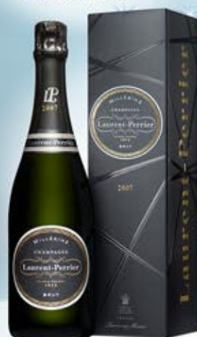
6701119 - C 67,10 * LAURENT PERRIER BRUT MILLESIME CL.75 CONF. X 1