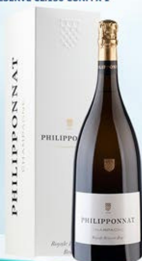
6701137 - C 108,20 * PHILIPPONNAT ROYALE RESERVE BRUT CL.150 CONF. X 1