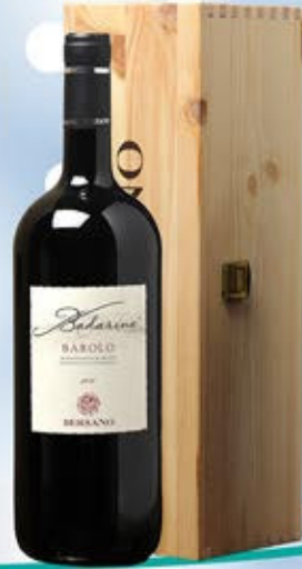
2101248 - C 74,90 BAROLO MAGNUM * CASSETTA LEGNO X MAGNUM * BAROLO DOCG BADARINA "BERSANO" CL.150