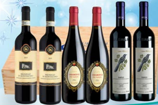
5083068 - C 199,00 SELEZIONE GRANDI ROSSI * CASSETTA IN LEGNO NATURALE "SQUILLARI" X 6 * 2 BRUNELLO DI MONTALCINO DOCG "CAMIGLIANO" CL.75 * 2 BAROLO DOCG "ABBONA" CL.75 * 2 AMARONE DELLA VALPOLICELLA CLASSICO DOCG SANTICO "SANTI" CL.75