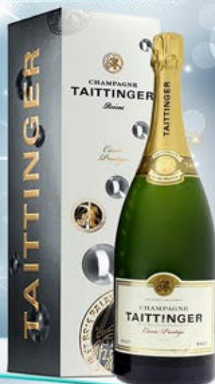
6701197 - C 108,90 * TAITTINGER CUVÉE PRESTIGE CL.150 CONF. X 1