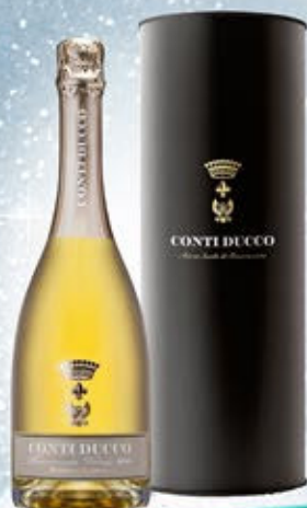
6601284 - C 24,50 * FRANCIA CORTA MILLESIMATO BLANC DE BLANCS "CONTI DUCCO" CL.75 CONF. X 1