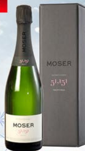
6601211 - C 23,50 * TRENTO DOC BRUT "MOSER 51,151" CL.75