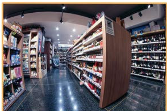
In Albaro: Via Trento 79r 16145 Genova - Tel. 010-364454

Tramite il nostro e-commerce potete acquistare i nostri prodotti e scaricare il nostro catalogo online