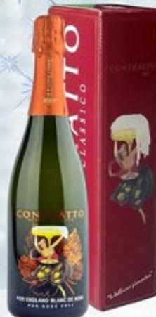
6601056 - C 31,90 *METODO CLASSICO ALTA LANGA BLANC DE NOIRS FOR ENGLAND "CONTRATTO" CL.75 CONF. X 1