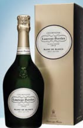
6701224 - C 95,50 * LAURENT PERRIER BLANC DE BLANCS BRUT NATURE CL.75 CONF. X 1