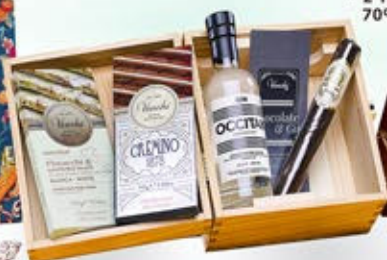
1402389 - C 34,90 CONFEZIONE VENCHI GIN CHOCOLATE EXPERIENCE * COFANETTO IN LEGNO * SPECIALITA' DI CIOCCOLATO "VENCHI" GR.300 * GIN OCCITAN DI BORDIGA LIMITED EDITION CL.20