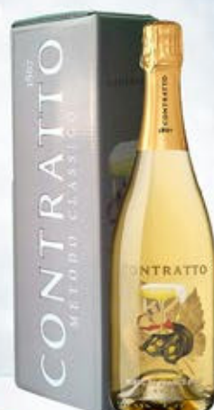
6601298 - C 31,90 *METODO CLASSICO ALTA LANGA BLANC DE BLANCS PAS DOSÉ "CONTRATTO" CL.75 CONF. X 1