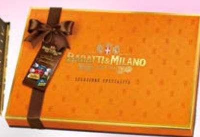
1402420 - C 16,90 * CONFEZIONE SELEZIONE SPECIALITA' "BARATTI & MILANO" GR.300