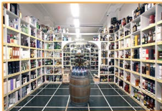
Sede storica di Sampierdarena: Via Cantore, 266r 16149 Genova - Tel. 010-5298570

Vi aspettiamo tutti i giorni, con orario continuato, nel mese di Dicembre anche la Domenica.