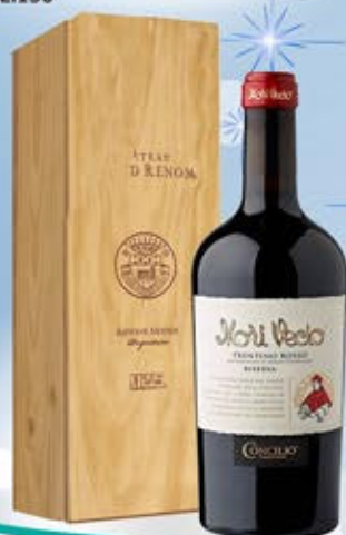
2104060 - C 39,90 MORI VECIO MAGNUM * CASSETTA LEGNO X MAGNUM * TRENTO ROSSO DOC RISERVA MORI VECIO "CONCILIO" CL.150