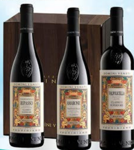
2083095 - C 64,90 DOMINI VENETI X 3 CASSETTA LEGNO X 3 * AMARONE DELLA VALPOLICELLA CLASSICO DOCG "DOMINI VENETI" CL.75 * RIPASSO CLASSICO SUPERIORE DOC "DOMINI VENETI" CL.75 * VALPOLICELLA CLASSICO SUPERIORE DOC "DOMINI VENETI" CL.75