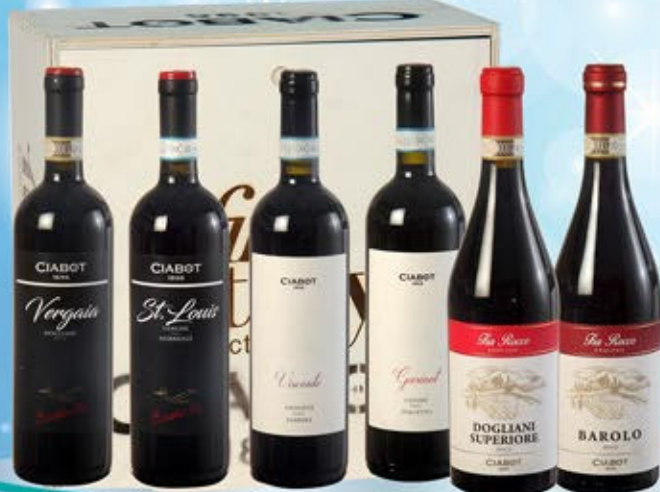
2083097 - C 69,90 CIABOT X 6 * BAROLO DOCG "CIABOT" CL.75 * DOGLIANI SUPERIORE DOCG "CIABOT" CL.75 * DOGLIANI DOCG "CIABOT" CL.75 * LANGHE DOC NEBBIOLO "CIABOT" CL.75 * LANGHE DOC DOLCETTO "CIABOT" CL.75 * PIEMONTE DOC BARBERA "CIABOT" CL.75