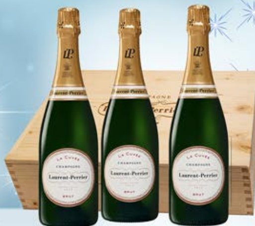
6701092 - C 123,50 * LAURENT PERRIER BRUT CL.75 CONF. X 3