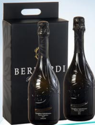
6601460 - C 19,50 BERNARDI X 2 * PROSECCO CONEGLIANO VALDOBBIADENE DOCG EXTRA DRY CL.75 * PROSECCO CONEGLIANO VALDOBBIADENE DOCG BRUT CL.75