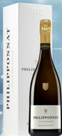
6701028 - C 48,30 * PHILIPPONNAT ROYALE RESERVE BRUT CL.75 CONF. X 1