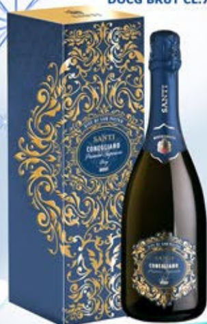
6601177 - C 10,50 * PROSECCO SUPERIORE DOCG CONEGLIANO BRUT MILLESIMATO "SANTI" CL.75 CONF. X 1