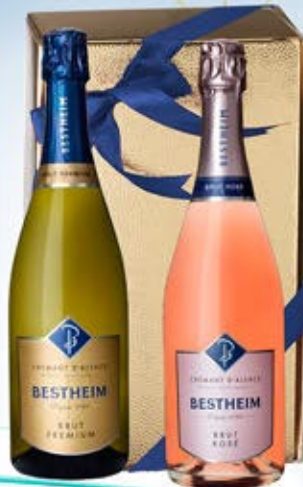
5081012 - C 29,50 CREMANT X 2 * CREMANT D'ALSACE BRUT "BESTHEIM" CL.75 * CREMANT D'ALSACE ROSÉ BRUT "BESTHEIM" CL.75