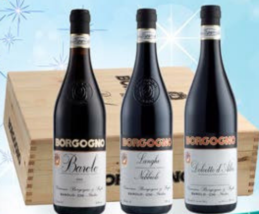
5083014 - C 93,00 BORGOGNO X 3 * CASSETTA LEGNO X 3 * BAROLO DOCG "BORGOGNO" CL.75 * LANGHE DOC NEBBIOLO "BORGOGNO" CL.75 * DOLCETTO D'ALBA "BORGOGNO" CL.75