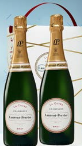
6701091 - C 79,90 * LAURENT PERRIER BRUT CL.75 CONF. X 2