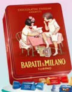
1402552 - C 16,00 * LATTA STORICA GRAN ASSORTIMENTO "BARATTI & MILANO" GR.300