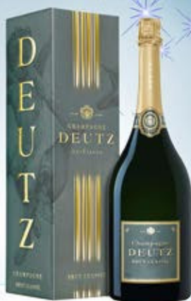
6701183 - C 46,90 * DEUTZ BRUT CLASSIC CL.75 CONF. X 1