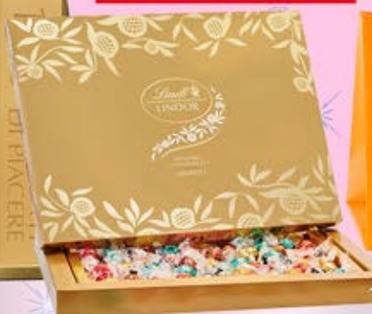
1402319 - C 30,00 * LINDOR ASSORTITA "LINDT" SCATOLA GR.725