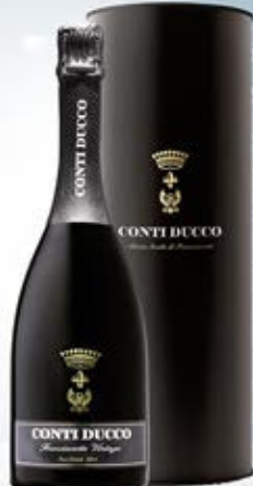
6601103 - C 27,90 * FRANCIA CORTA MILLESIMATO PAS DOSÉ "CONTI DUCCO" CL.75 CONF. X 1