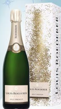
6701002 - C 56,60 * LOUIS ROEDERER BRUT PREMIER CL.75 CONF. X 1