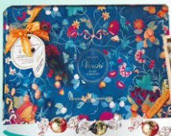
1402650 - C 17,50 * SCATOLA REGALO GEMME "VENCHI" GR.250