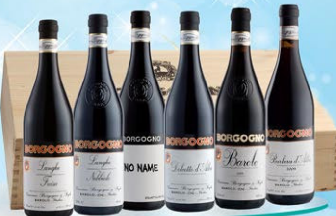
5083059 - C 157,00 BORGOGNO X 6 * CASSETTA LEGNO X 6 * BAROLO DOCG "BORGOGNO" CL.75 * LANGHE DOC NEBBIOLO "BORGOGNO" CL.75 * DOLCETTO D'ALBA DOC "BORGOGNO" CL.75 * BARBERA D'ALBA DOC "BORGOGNO" CL.75 * LANGHE DOC FREISA "BORGOGNO" CL.75 * NEBBIOLO NO NAME "BORGOGNO" CL.75