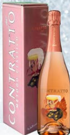
6601301 - C 31,90 *METODO CLASSICO ROSÉ PAS DOSÉ FOR ENGLAND "CONTRATTO" CL.75 CONF. X 1