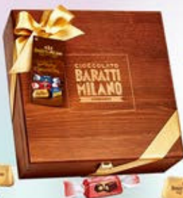
1402480 - C 20,00 * SCRIGNO LEGNO PRALINE ASSORTITE "BARATTI & MILANO" GR.280